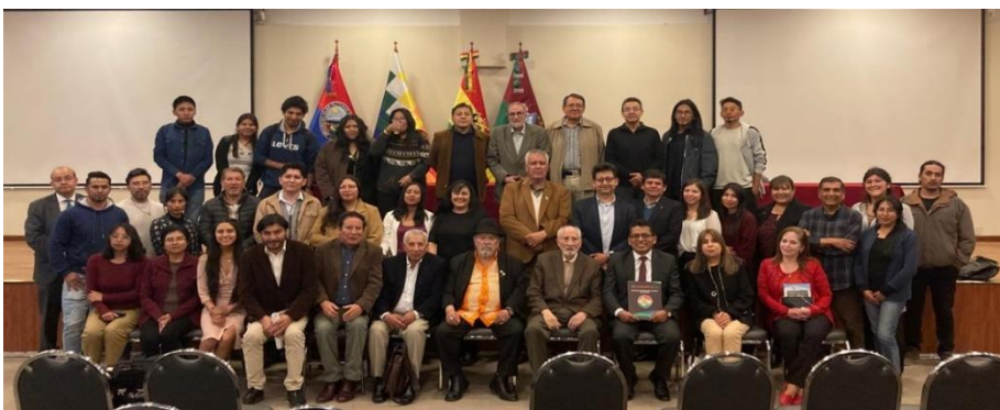
Foto de clausura de la “CUMBRE NACIONAL DE EDUCACIÓN SUPERIOR, CIENCIA, TECNOLOGÍA E INNOVACIÓN” 7 y 8 de noviembre de 2024.

El programa se desarrolló en cinco ejes temáticos: Educación Superior; Recursos Hídricos; Seguridad Alimentaria; Transición Energética y Cambio Climático.